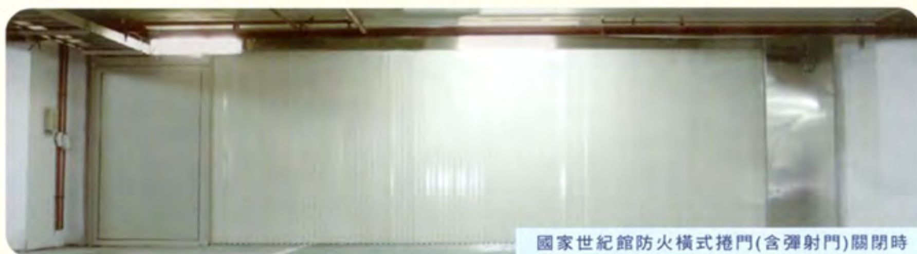
國家世紀館防火橫式捲門(含彈射門)關閉時