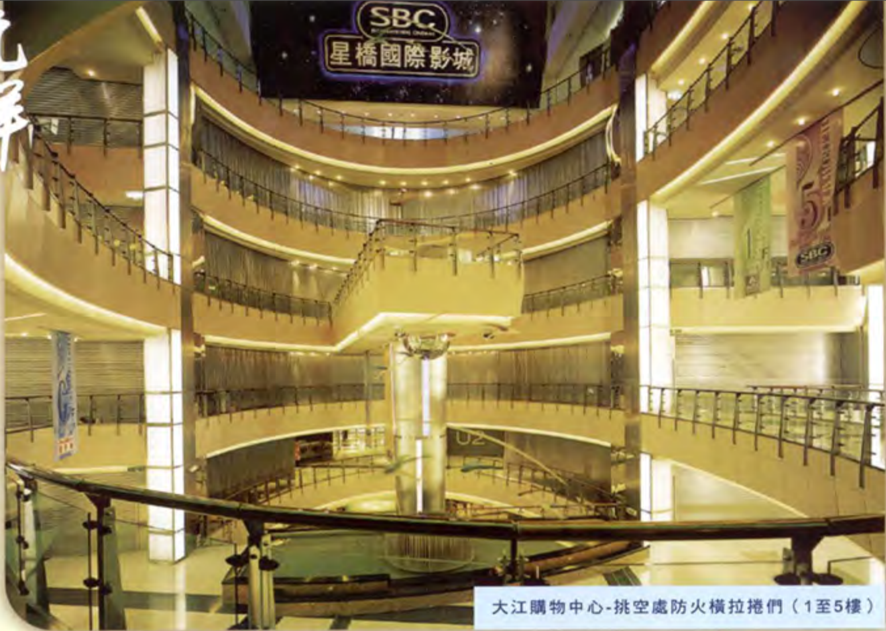
大江購物中心-挑空處防火橫拉捲門 (1至5樓)