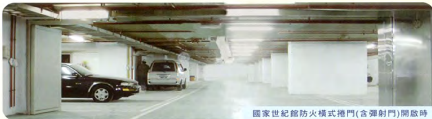
國家世紀館防火橫式捲門(含彈射門)開啟時