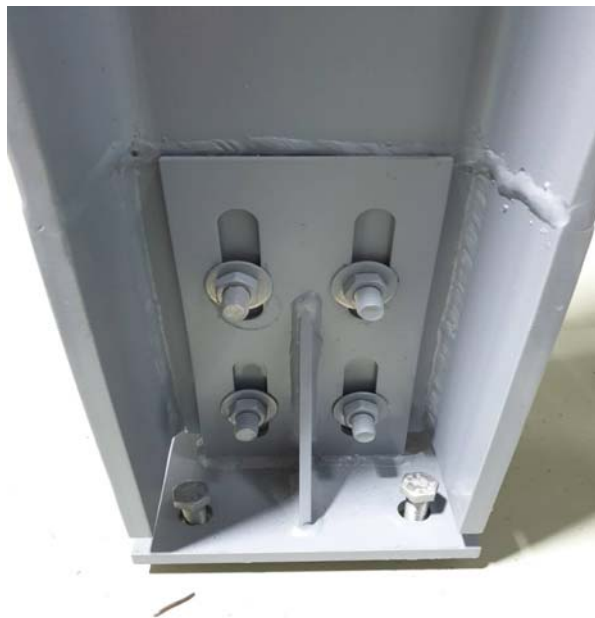
圖 2. H 型鋼中柱底部鎖固板降下並把四支螺絲鎖下地面預埋螺栓牙套