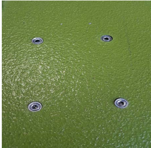
圖 1.地面預埋螺栓牙套及防塵螺絲(平常未使用時)

步驟 2.再將 H 型鋼中柱安裝定位之地面預埋螺栓牙套上之防塵螺絲折起(圖 1)，並把 H 型鋼中柱底部鎖固板降下並把四支螺絲鎖下將中柱與地面固定(圖 2)。